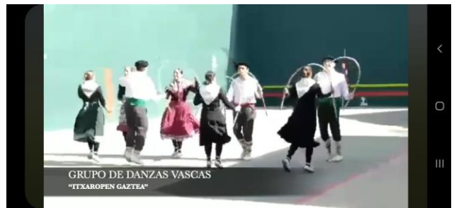
Grupo de danzas vascas Itxaropen Gaztea en una de las actuaciones presenciales.