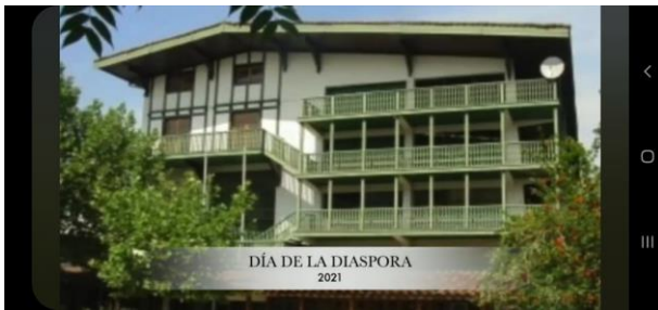
Euzko Etxea de Santiago publicó un video de saludo a toda la Diáspora en las redes sociales.