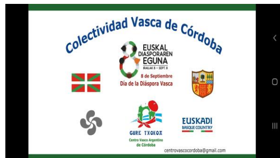
Córdoba- Argentina presente en redes sociales.