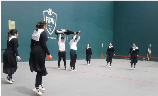
Grupo de danzas vascas Itxaropen Gaztea presentándose para San Miguel Arcángel.