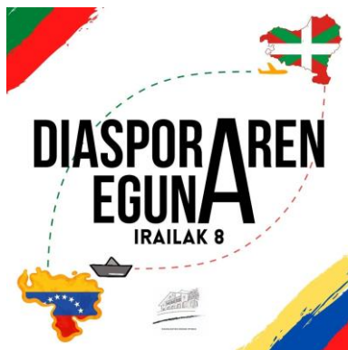
Saludo desde Caracas.