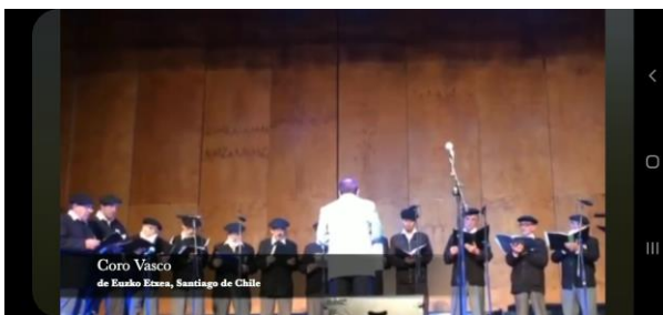
Nuestro Coro Vasco canta en el video de saludo a los vascos de la Diáspora.