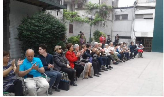
Entusiasta público en nuestra casa vasca.