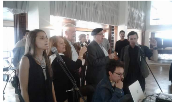
El infaltable Karaoke al final de la tarde, cantando temas en Euskera.