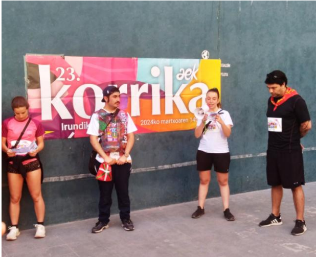
Momento de la lectura del manifiesto.