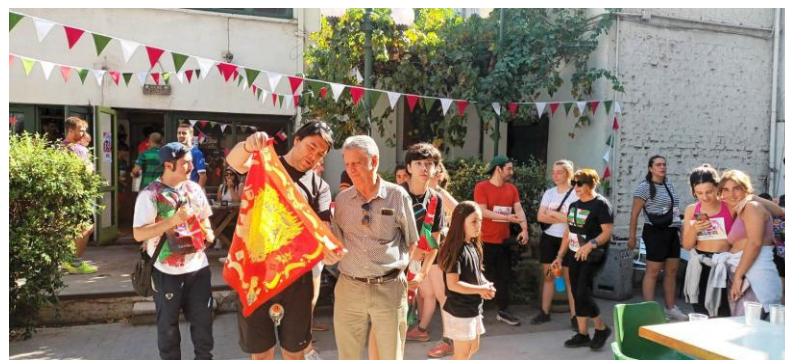
En el frontón de nuestra casa a la espera del acto de lectura del manifiesto.