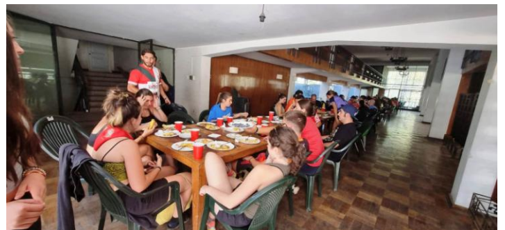
Almorzando en el salón del segundo piso.