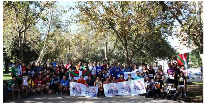
Primera parada en el Parque Bustamante.