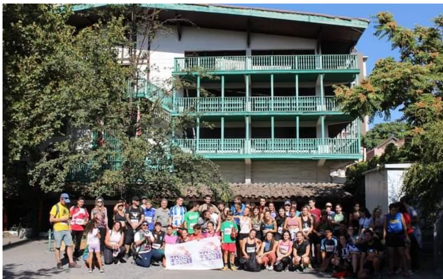
Nuestro Presidente recibe en Euzko Etxea a los participantes de la Korrika 2024.