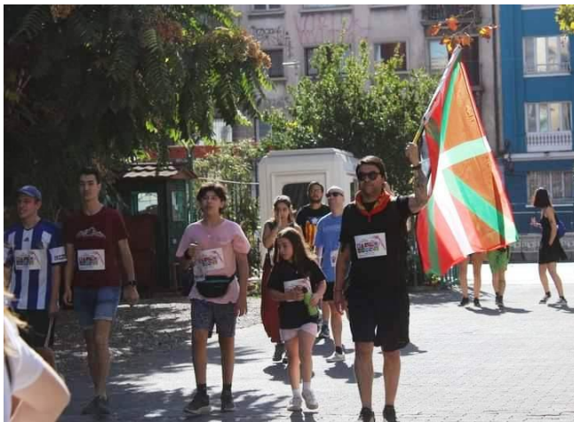
La Korrika ingresa a nuestra casa vasca.