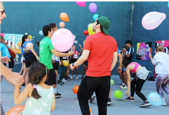
Entretenidas actividades programadas.