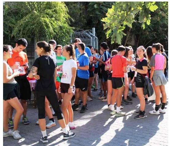
Muy buena concurrencia de jóvenes.