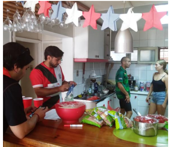
Nuestros jóvenes preparando el almuerzo.