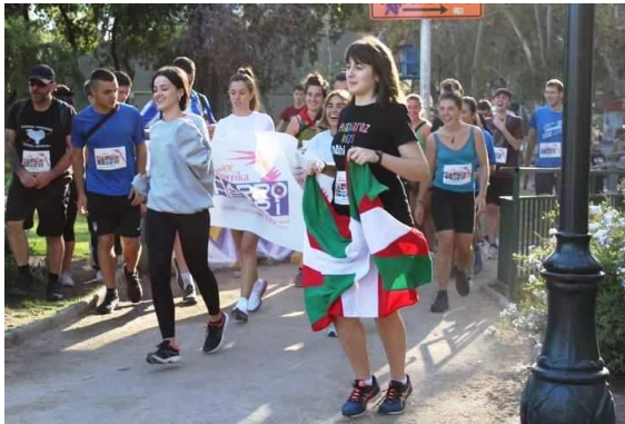
Inicio de la Korrika, mucho entusiasmo.

la ceremonia de rigor (lectura del manifiesto en Euskera y en Castellano), se organizó un almuerzo y actividades programadas por nuestros jóvenes durante toda la tarde de ése día. Un entretenido día de camaradería y amistad en torno a nuestra hermosa lengua el Euskera.